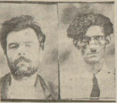
İşi beyaz zehir kaçakçılığına döken sabıkalılardan ikisi

kayı ele vermemek bakımından beyaz zehir satanların işini kolaylaştırmaktadır.