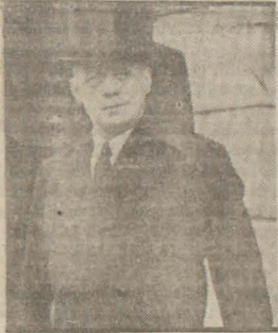
Ribbentrop (Yazısı 7 inci sayfada)

Bulgar Nazırları Almanyaya muvasalat ettiler